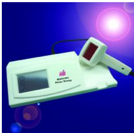
Das Photon-Therapiegerät Bionic 880

Hinzu kommen Leiden psychischen Ursprungs, beispielsweise körperlicher und emotionaler Stress, Süchte, soziale und berufliche Belastungen, Kindheitstraumata, Konflikt- und Krisensituationen. Wir leben in einer Gesellschaft mit hohen Leistungsansprüchen: Höher, schneller, weiter. Photonen-Mangel kann sich in Form von Krankheit in unserem Körper manifestieren. Als Gegenmaßnahme gilt es, den Zellen die Möglichkeit zurückzugeben, wieder optimal zu funktionieren.